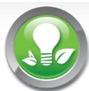
Circulateur haute efficacité

La Station Solaire Compacte DN20 assure la circulation efficace du fluide caloporteur dans le circuit solaire. Elle regroupe l'ensemble des composants nécessaire au bon fonctionnement du circuit primaire solaire.